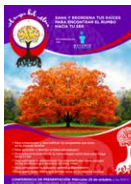
📍 EL MAPA DEL ALMA

Para todos los alumnos de la Escuela recomendamos cursos complementarios a la formación. Éstos son algunos, los iremos reflejando progresivamente en la web y en la agenda electrónica.