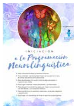
📍 INICIACIÓN A LA PROGRAMACIÓN NEUROLINGÜÍSTICA