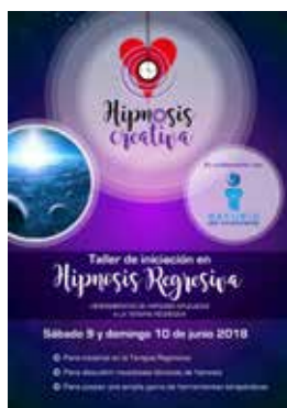
📍 HIPNOSIS CREATIVA