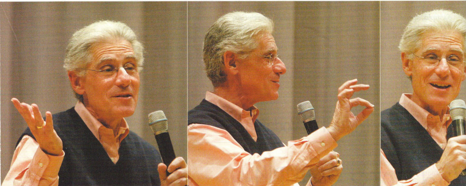
Brian Weiss no pretende convencer a nadie, simplemente comparte su sabiduría y experiencia con alegría.

Brian Weiss, en su reciente visita a España, nos habla de la importancia de recuperar nuestras vidas pasadas, para curar los problemas que atormentan nuestros presentes, y de proyectarnos a las futuras, para tomar las decisiones correctas aquí y ahora.